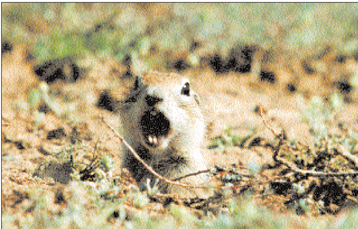
Суслик-сторож. Обеспокоенный присутствием человека, он кричит по-птичьи.

В старых сорочьих и грачиных постройках гнездятся мелкие соколы — пустельги и кобчики. Ближе к вечеру на луговых участках пасутся зайцы-русаки. Рассядутся в травах, одни уши торчат. Скачут, кормятся, время от времени встают на задние лапки, тянутся, осматриваясь вокруг, нет ли врагов поблизости. А коль есть зайцы, то на них и лисы найдутся, обыкновенные, рыжие и степные, корсаки. Тут же, по соседству, на степных участках токуют, раздувая черно-