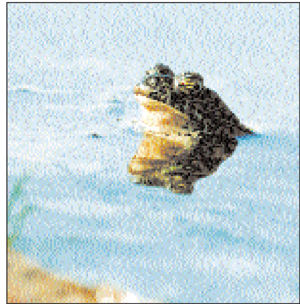
Лягушка — обычная обительница арыков.