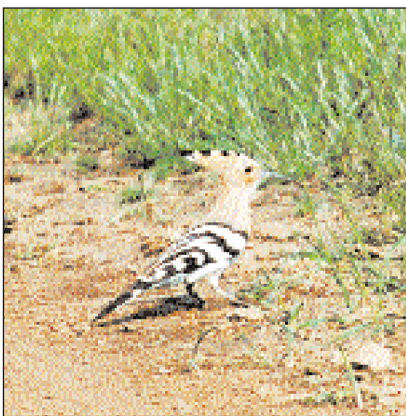
Удод. Его можно встретить в разных местах, чаще — возле человеческого жилья.