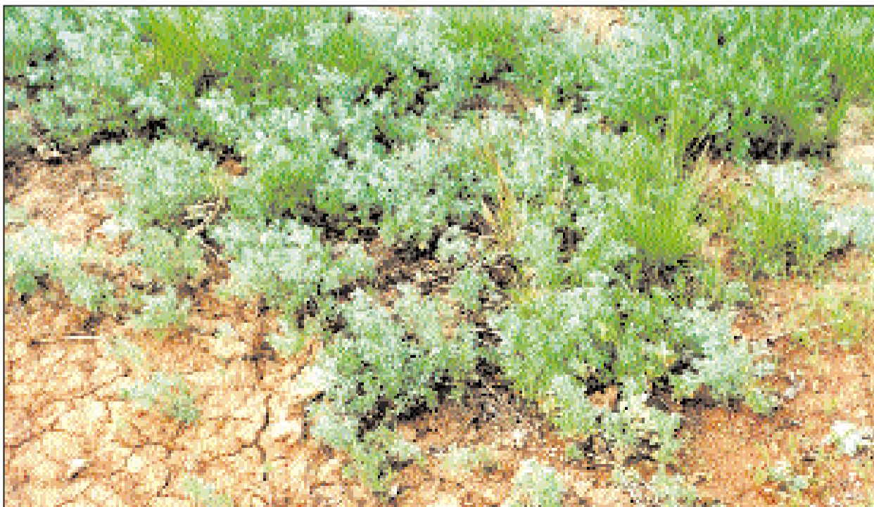
Полыни — доминирующие виды в окрестностях Джаныбека.