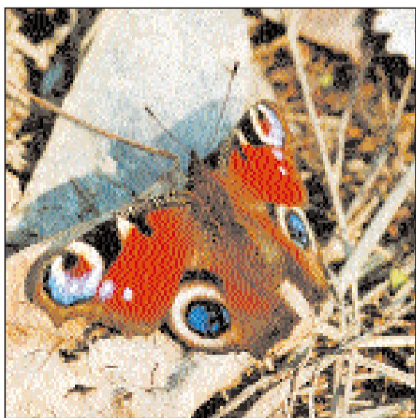
Павлиний глаз — далеко не единственный вид бабочек в Джаныбеке.