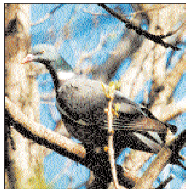
Вяхирь. Огромные стаи этого голубя бывают в Джаныбеке на пролете.