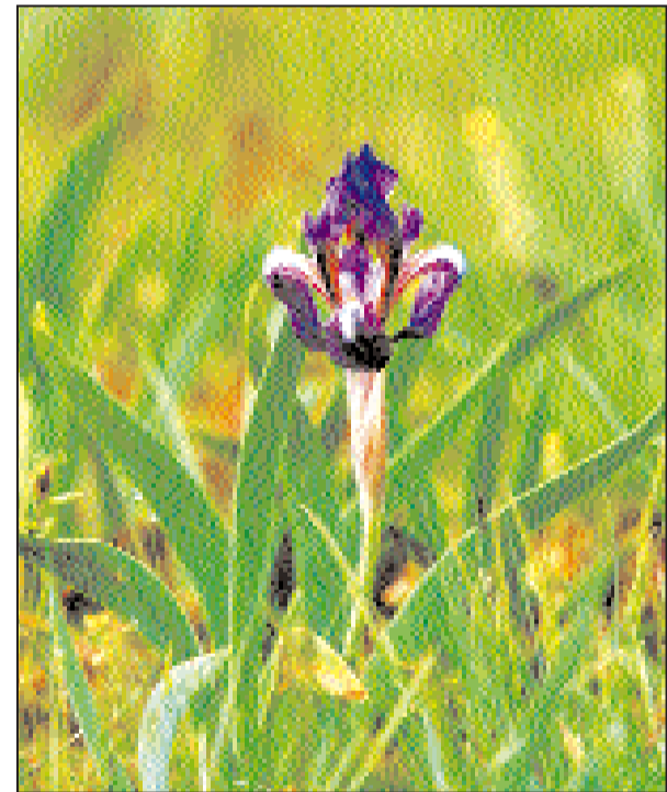
Полупустынные растения в цвету: тюльпаны и ирис.