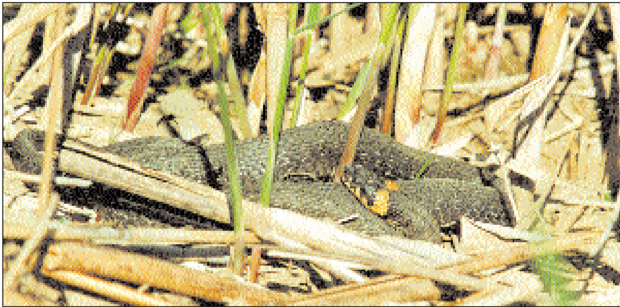
Уж в тростниковых зарослях.