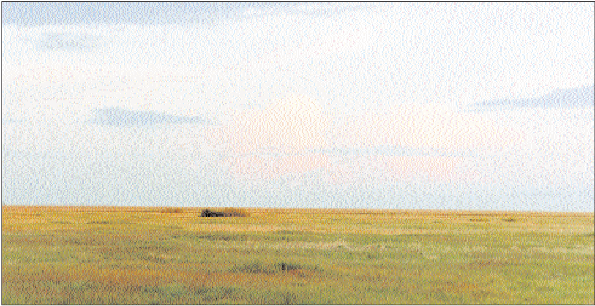
Не степь, не пустыня — полупустыня.