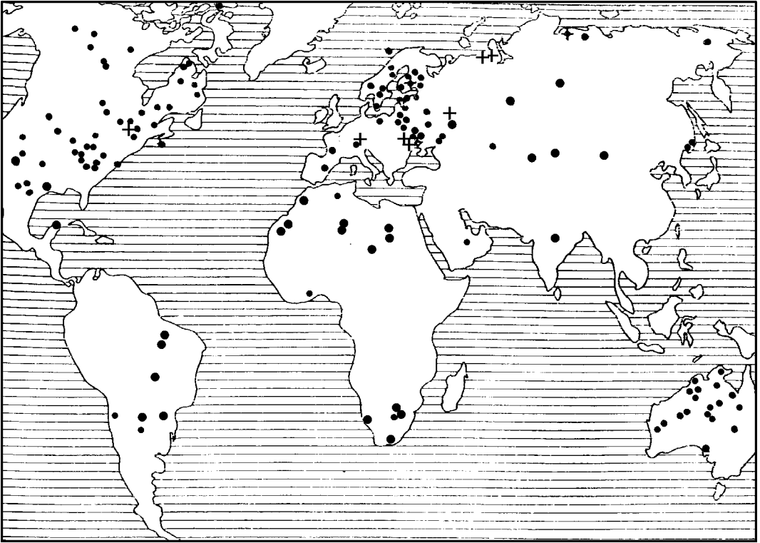
Импактные структуры (астроблемы) мира. Астроблемы с алмазосодержащими импактитами отмечены крестиком.

ся с каждым годом. Залегающие в них породы возникли при чудовищных по своей мощи космических взрывах (в частности, испытали импульсное сжатие до 500–600 кбар и более) и обладают четко выраженными признаками ударно-волновых преобразований порообразующих минералов, включая их аморфизацию, переход в фазы высокого давления или даже плавление. При этом из различных местных горных пород получают даже сплошные массы застывшего расплава.