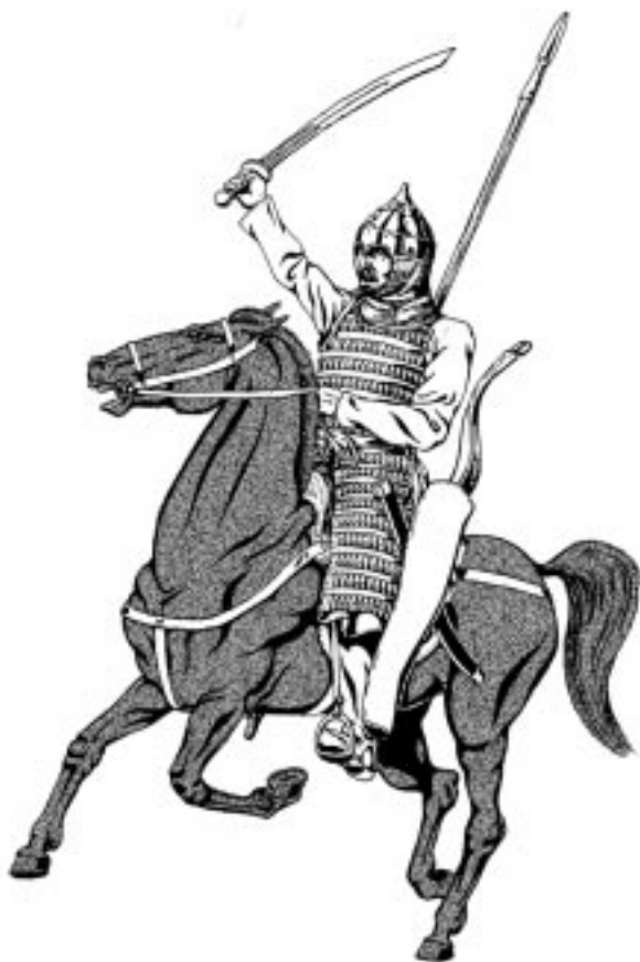
Воин Лесостепного Алтая. XIII—XIV вв.

нию. Для закрепления территорий организовывались военные поселения выходцев из внутренних районов империи. В 1368 г. империя Юань пала в результате восстания в Китае. На территории Центральной Азии и Южной Сибири возник целый ряд мелких ханств, управление в которых принадлежало местной аристократии.