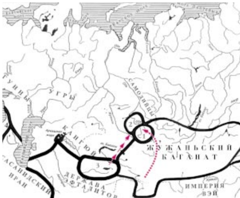
Этнополитическая ситуация в Евразии в середине IV в. 1 — одинцовская культура; 2 — булан-кобинская культура; 3 — кенкольская культура; 4 — Византийская империя. Здесь и далее объединения племен и государства представлены на фоне