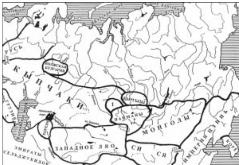
Этнополитическая ситуация в Евразии в конце XII в. 1 — сротскинская культура.

С начала XIII в. народы Центральной Азии начали объединяться под властью монголов. В 1204 г. монголы разбили войско найманов. Однако найманские владения в Горном Алтае и Туве, видимо, сохранили независимость, и монголам потребовался специальный большой поход в Южную Сибирь для ее покорения. В 1207 г. монгольская армия под командованием Джучи, сына Чингисхана, обрушилась на племена Саяно-Алтайского нагорья. Горный Алтай, Тува и Минусинская котловина были включены в состав улуса Джучи, столица которого находилась на Иртыше. Но уже в 1218 г. вспыхнуло антимонгольское восстание, которое возглавили кыргызы. Джучи разбил и вновь покорил повстанцев. После смерти Джучи (1227) земли Южной Сибири отошли во владения к улусу великого хана Тулуя, а затем к Юаньской империи, созданной великим ханом Хубилаем (см. схему). Новое восстание 1273 г. вернуло независимость населению Южной Сибири на 20 лет. Только в 1293 г. монгольская армия кыпчака Тутуха (полководца Хубилая) разбила кыргызов и их союзников. Территория Саяно-Алтайского нагорья вошла в состав Юаньской провинции Лин-бей. Частые войны XIII в. привели к сокращению населения Горного Алтая и других земель, что подтверждается небольшим количеством археологических памятников того времени. С целью ослабить местные племена юаньские власти прибегали к насильственному переселе-