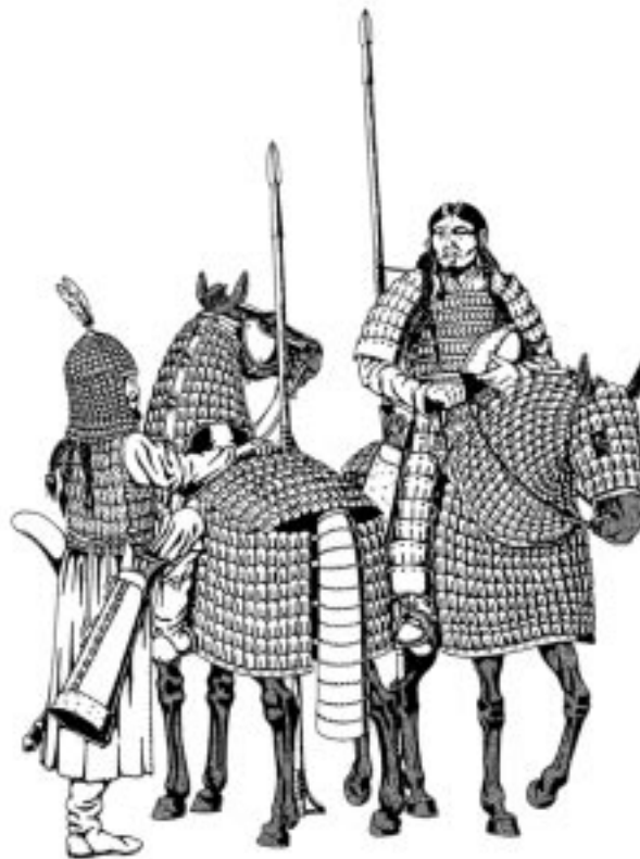
Тюркские воины. VI—VIII вв.

Этнополитическая ситуация в Евразии во второй половине VI в. 1 — единцовская культура; 2 — Византийская империя; 3 — Аварский каганат.