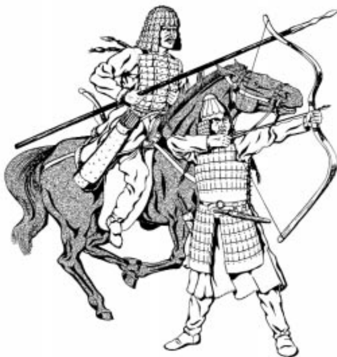
Горноалтайские воины. III—V вв. (Все приводимые в статье рисунки выполнены Д.В.Поздняковым на основе реконструкций, сделанных В.В.Горбуновым.)

ликуемые факты помогают также оценить острые политические коллизии, которыми была богата Азия и которые наложили печать на историческое развитие Европы.