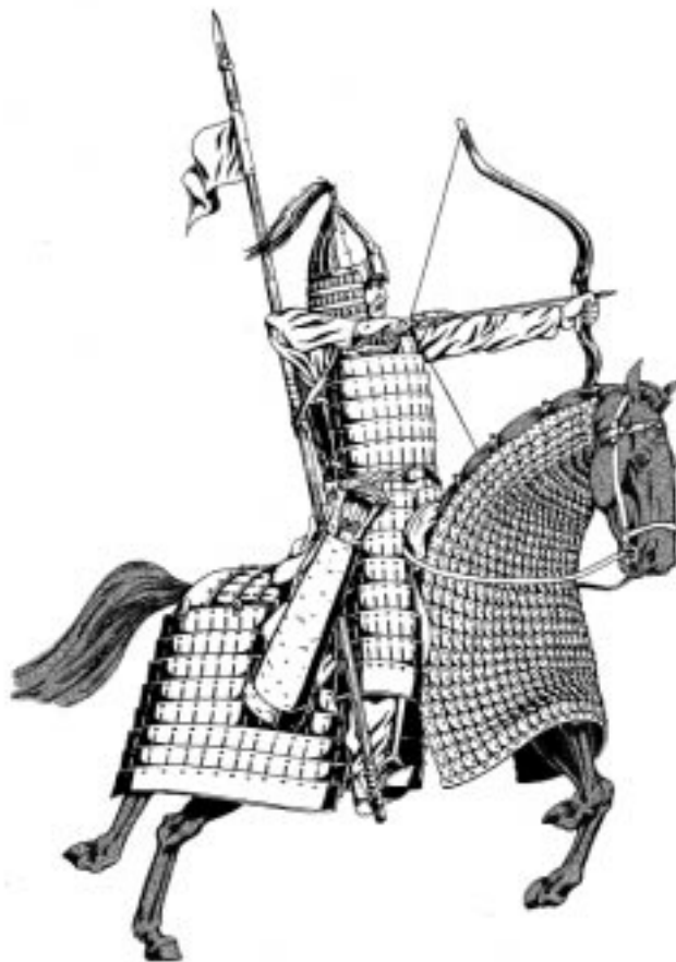
Горноалтайский воин. XII—XIV вв.