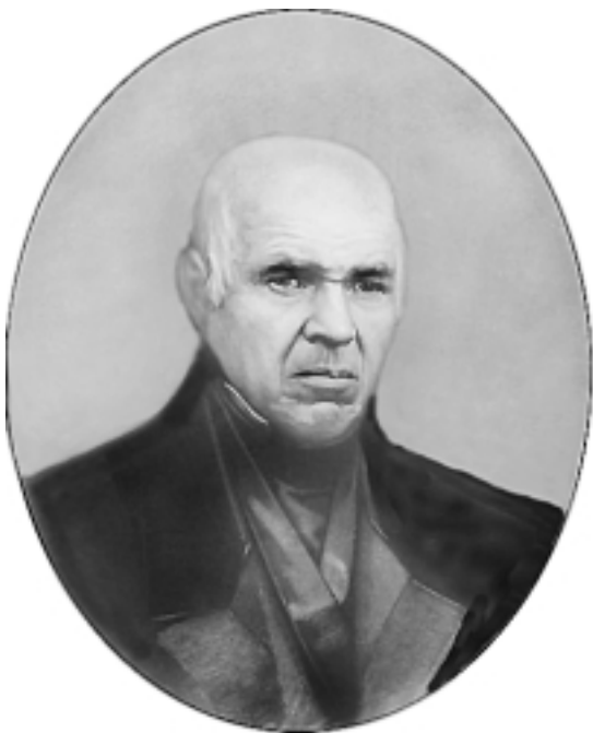
Иван Алексеевич Второв (1772—1844). Рисунок И.Н.Крамского с дагерротипа. Итальянский карандаш.

«Предлагаемая хроника составила случайно, — писал биограф. — Большинству читателей герои ее, Второвы, едва ли известны; но многим книжным, литературным людям, мы полагаем, еще памятно имя Второва-сына... Второв-отец был в свое время... тоже известность, замечательность, хотя и провинциальная. Он был знаком почти со всеми писателями своего времени; он собрал замечательную библиотеку, из которой образовалась потом Казанская городская библиотека; он знал почти все Поволжье, где жил и действовал не бесплодно. Если не масон, то ученик масонов, он был для своего времени весьма типичной личностью, по развитию и образованию стоял в числе передовых людей, хотя занимал самое скромное положение, не на вершинах общественности, а на одном из флангов общественного строя. <...>