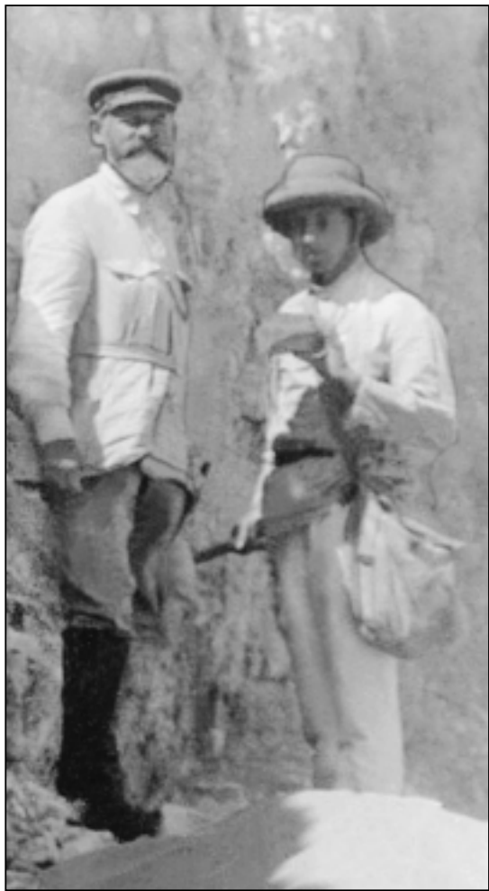
Л.С.Берг и К.К.Марков на полевых исследованиях, 1923 г.