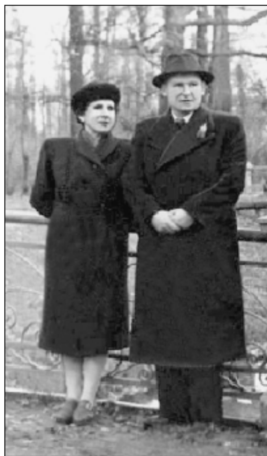
А.П.Жузе и К.К.Марков, 1949 г.