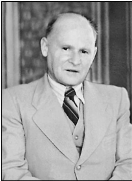
К.К.Марков, 1957 г.