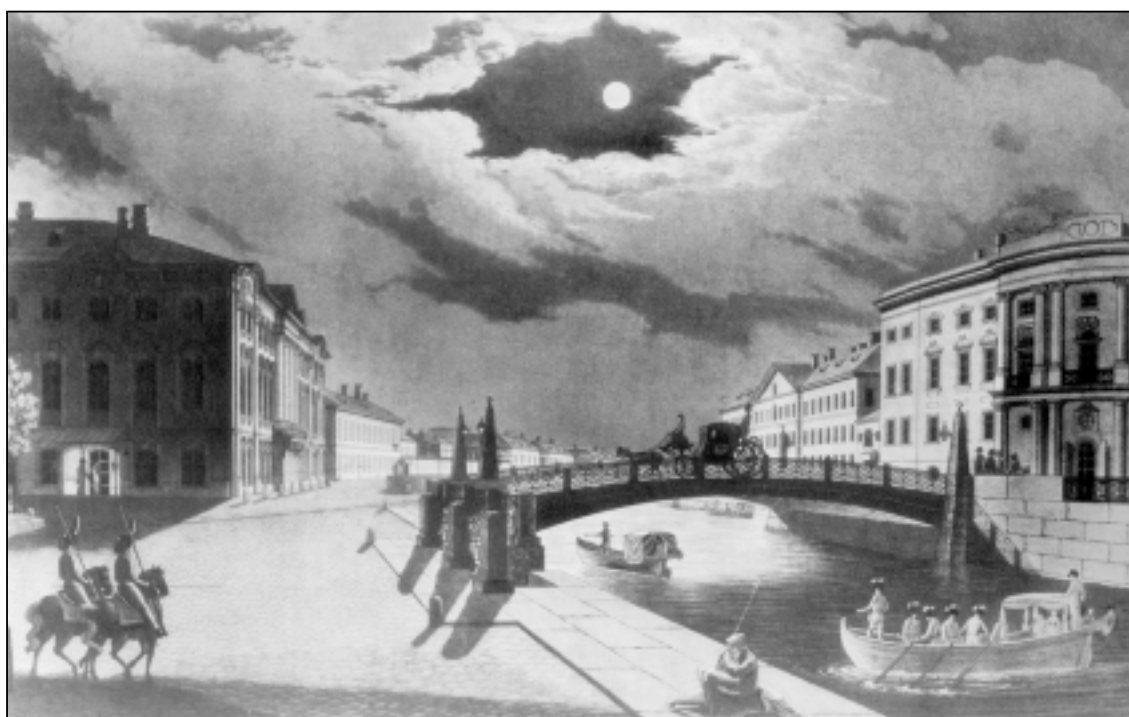
Петербург. 1830-е годы. Вид Мойки, снятый со стороны Красного моста. Литография К.П.Багрова по рисунку В.С.Садовникова.

В 1822 г. (второе посещение) он еще по-прежнему впечатлителен (хотя Второву перевалило за пятьдесят). Описание Невского проспекта заставляет вспомнить о гоголевском: «Около трех верст шел я пешком, но путь самый приятнейший. Длинные цепи огней