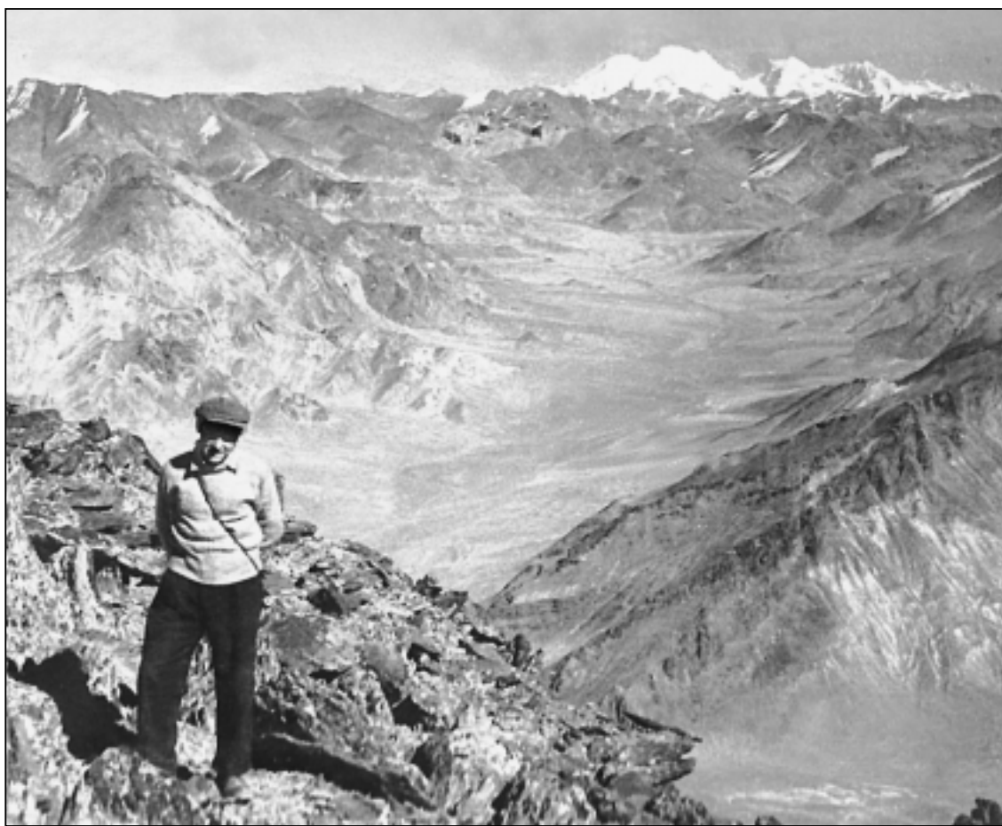
На Памире, 1946 г.

В феврале 1945 г. К.К. перешел на работу в Московский государственный университет им.М.В.Ломоносова. Долгие годы он был профессором, заве-