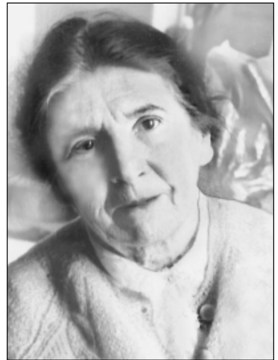
В 1980 г.

А.П. была безусловным научным лидером, авторитет которого признавали не только многочисленные коллеги и ученики