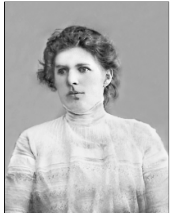
Л.Л.Жузе (1880–1931). Фотография 1907 г., Казань.

Первые годы Анастасия училась в гимназии в Казани,