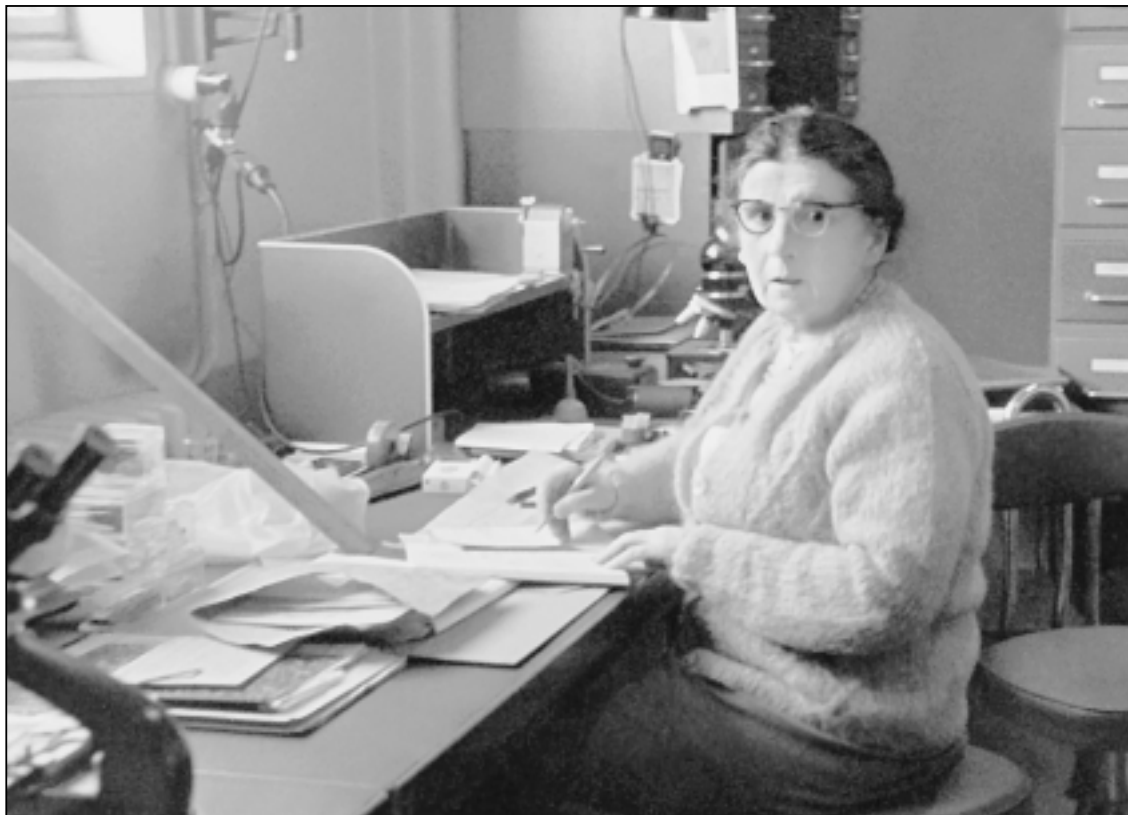
А.П.Жузе в Париже, в лаборатории Ж.Дефляндра, 1966 г.

В 1959 г. А.П. защитила докторскую диссертацию, которая в 1962 г. была опубликована в виде монографии «Стратиграфические и палеогеографические исследования в северо-за-