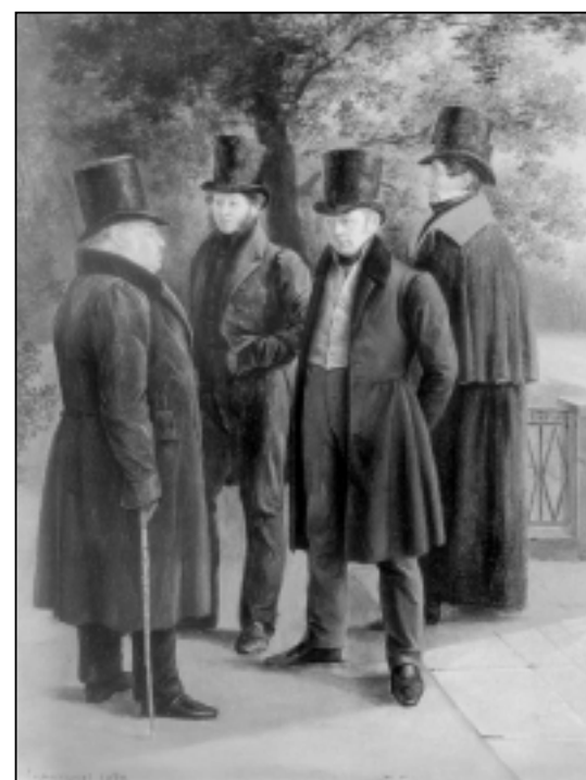
Группа писателей в Летнем саду: И.А.Крылов, А.С.Пушкин, В.А.Жуковский, Н.И.Гнедич. Этюд Г.Г.Чернецова. 1832 г.