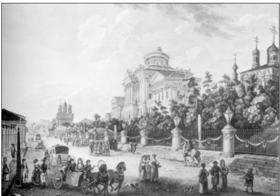
Москва, 1799 г. Вид Моховой и дома Пашкова. Гравюра на меди Ф.Лорье с оригинала Ж.Деламбарта.

Второв-провинциал посещает театр университетского благородного собрания (до четырех тысяч персон... русский язык слышен весьма редко), Петровский театр, академии (клубы) музыкальную и танцевальную (при жизни царствовавшего тогда императора Павла запрещены были и названия клубов). В Петровском театре «на-