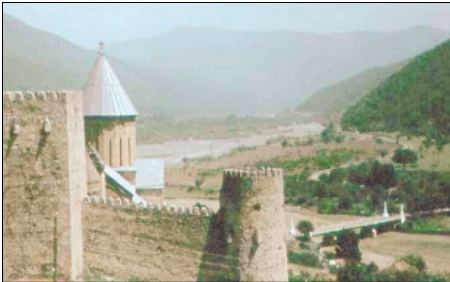
Крепости — неотъемлемый элемент пейзажа сочленения флишевой зоны Южного склона Большого Кавказа и Закавказского массива. Крепость Ананури на Военно-Грузинской дороге (р.Арагви).