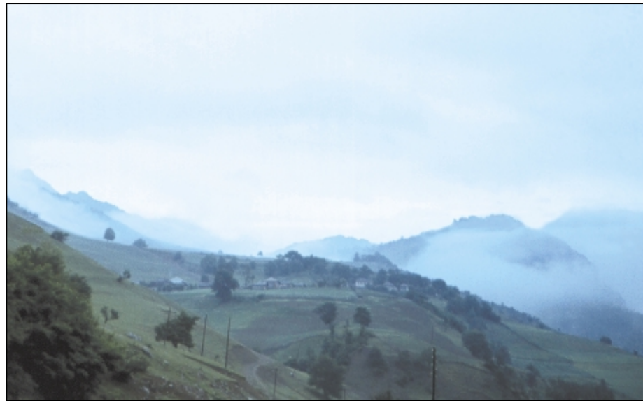
Среднегорный рельеф Дзирульского массива.