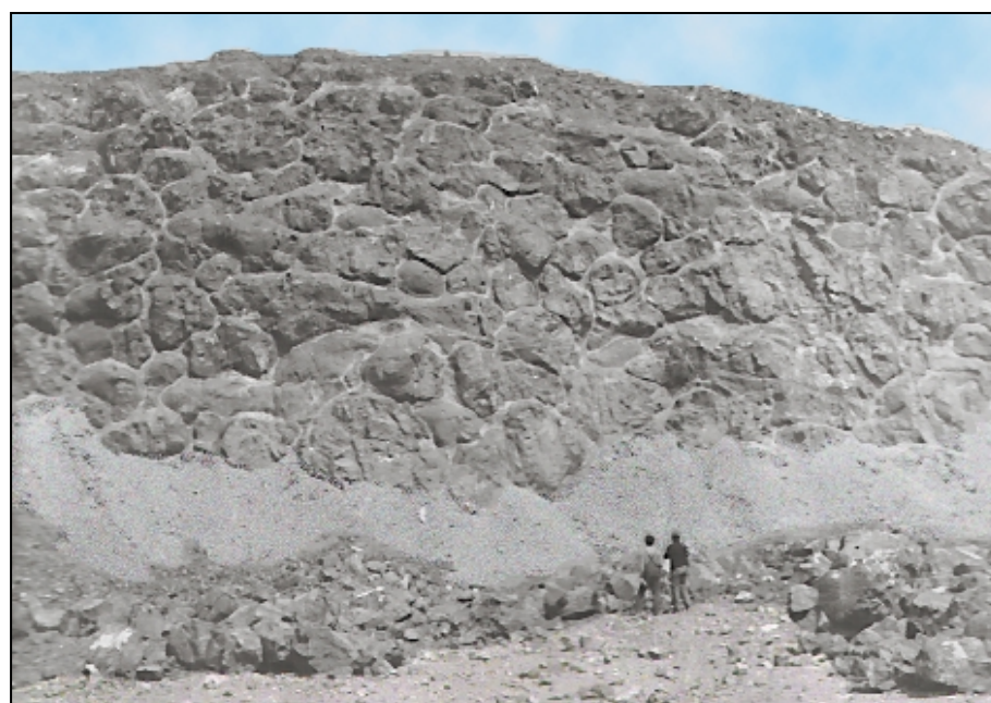
Шаровые лавы, образовавшиеся в результате вулканических излияний на дне древнего океанического бассейна.

В палеозое северная часть Кавказа представляла собой континентальную окраину океана Палеотетис. Вначале она походила на современную западную (пассивную в тектоническом отношении) окраину Атлантического океана, а затем трансформировалась в окраину типа Южно-Американского побережья Тихого океана, которая славится