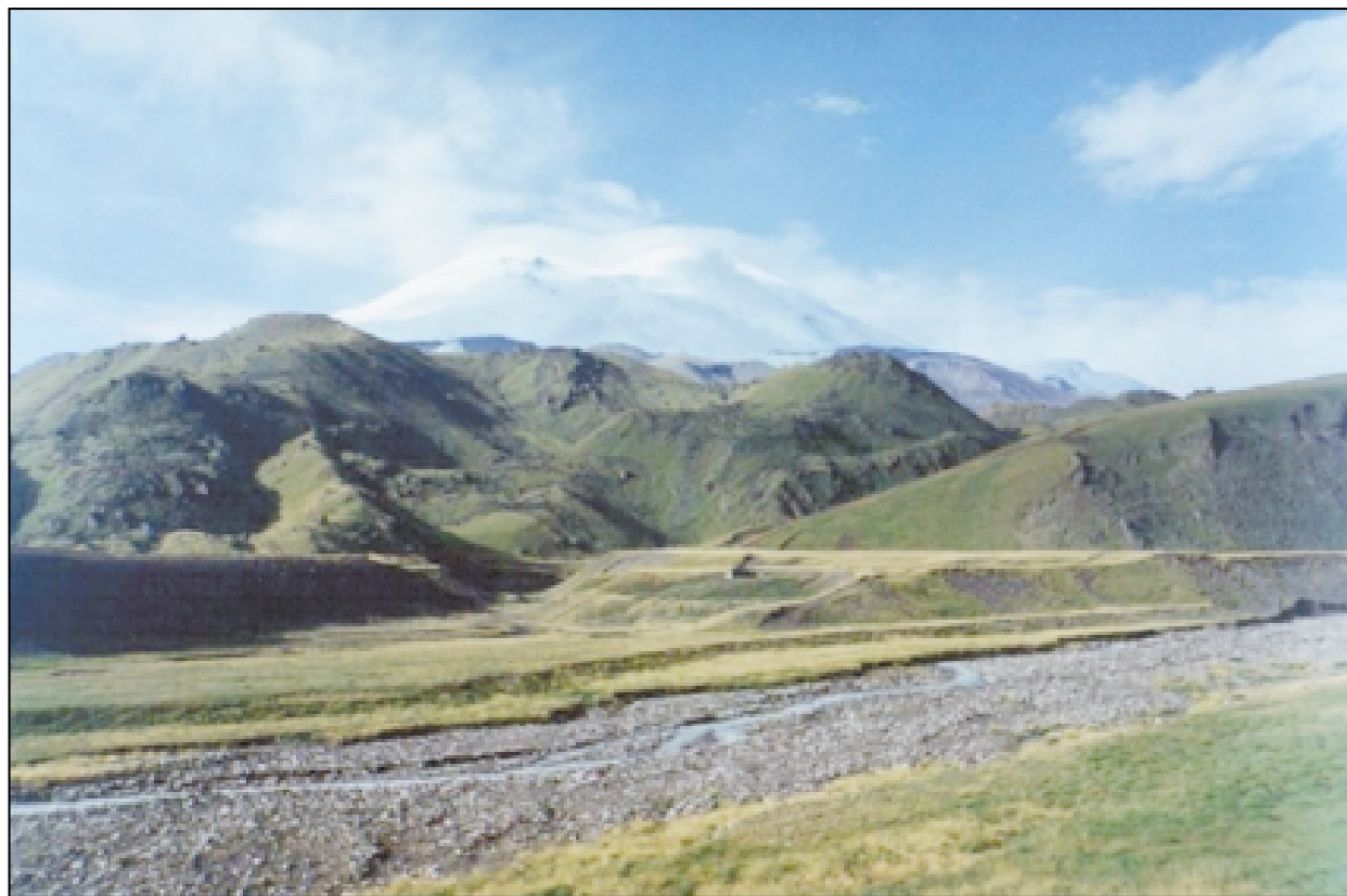
Эльбрус — высочайшая вершина Большого Кавказа.

Фото Т.Ю.Тверетиновой, компьютерная обработка М.Г.Леонова