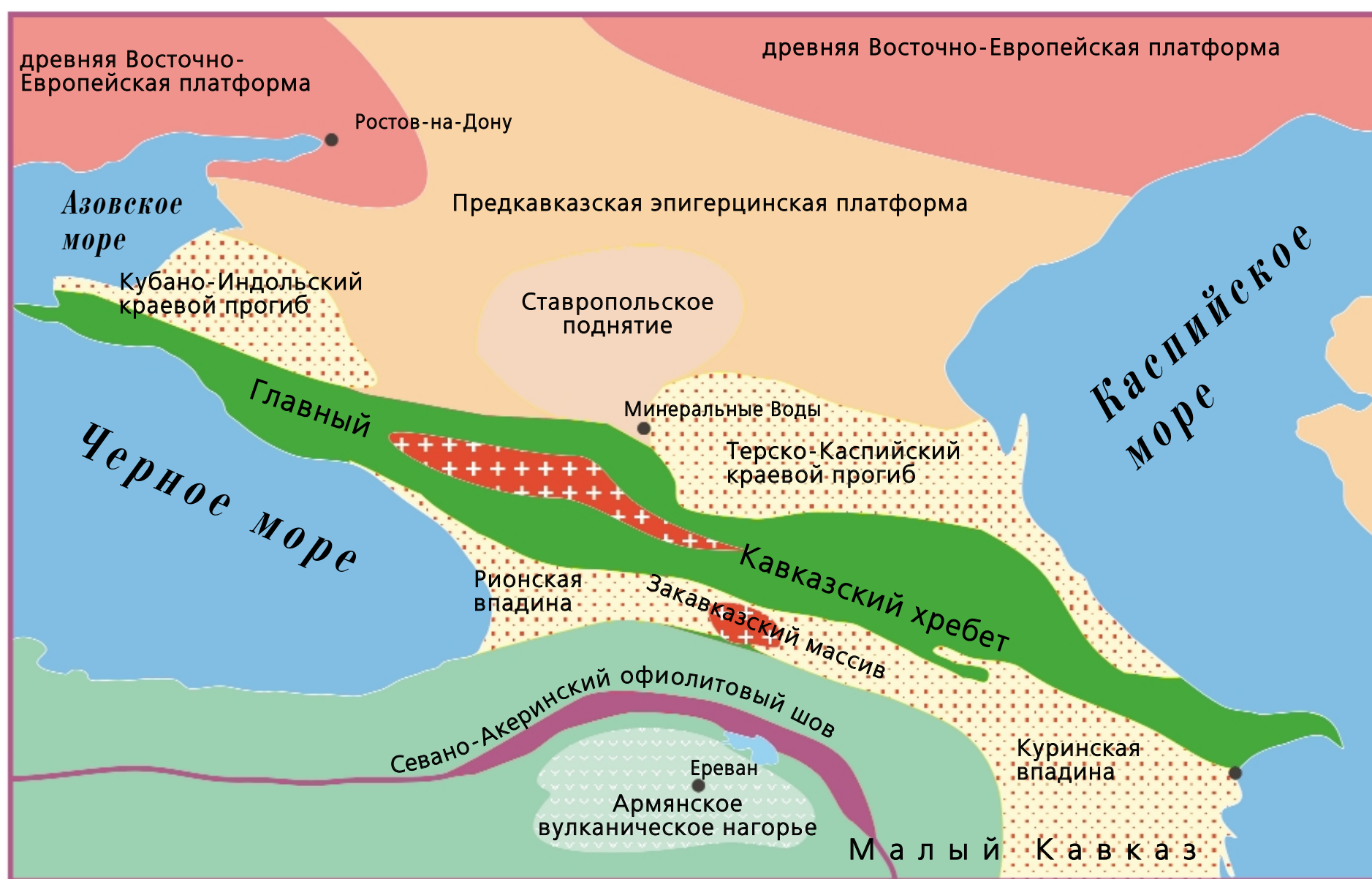
Схема геологического строения Кавказа.

очертаниями и причудливую, отчетливую воздушную линию их вершин и далекого неба... Сначала горы только удивили... потом обрадовали; но потом... он мало-помалу начал вникать в эту красоту и почувствовал горы» (Л.Н.Толстой).