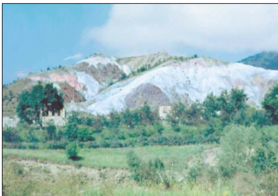
Цветной серпентинитовый меланж — это почти все, что осталось от палеоокеана Тетис.

Геологическая история Малого Кавказа чрезвычайно сложна. Но можно выделить две самые главные и характерные особенности. Во-первых, на протяжении большей части мезозоя (около 200 млн лет) территория Малого Кавказа представляла собой часть обширного и глубокого океана; а во-вторых, здесь проявилась интенсивнейшая вулканическая деятельность, сравнимая по мощи лишь с наиболее активными вулканическими районами мира (Исландией, Камчаткой). Уже в раннем мезозое к югу от Закавказского микроконтинента располагалась малокавказская ветвь океана Тетис. Еще южнее находились микроконтиненты Анатолийско-Иранской области. Где-то на рубеже 180 млн лет тому назад образовался Закавказский вулканический пояс типа островной дуги (как Камчатка или Курильские о-ва). Началось общее сжатие и постепенное закрытие океанического пространства за счет сближения микроконтинентов и общего движения Индо-Аравийской платформы к северу. Примерно на рубеже 100—85 млн лет тому назад Малокавказский бассейн закрылся. На его месте сформировались узкие швы, в которых были зажаты фрагменты пород океанической коры. Образовался единый континентальный блок, неоднократно подвергавшийся тектонической переработке и деструкции, что, в частности, выразилось в массовом проявлении вулканизма.