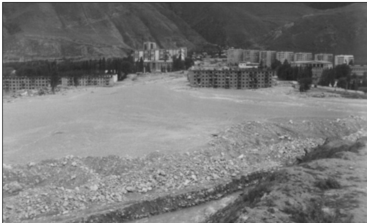
Тырныауз после схода селевого потока.