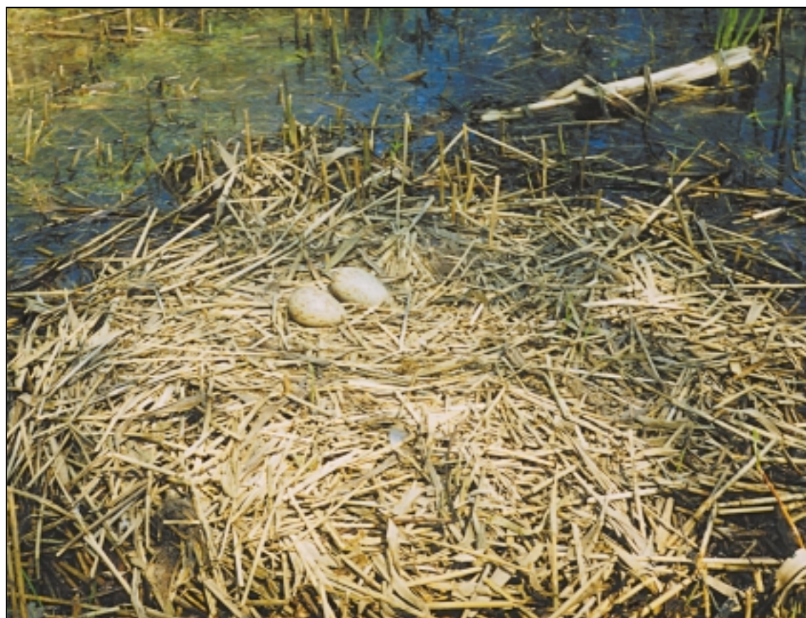
Будто бы и не в гнезде, а на куче травы отложены яйца.