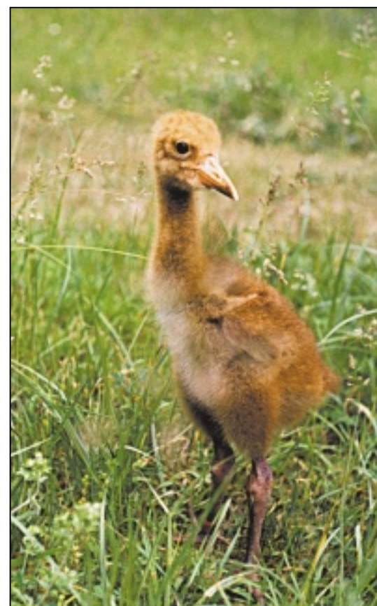
Совсем мал, но внимателен.