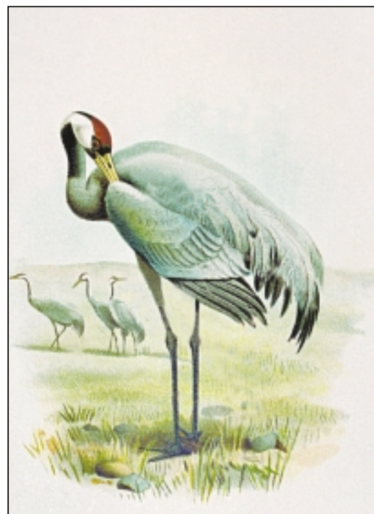
Красивая и элегантная птица — журавль.

Его журавушка чуть замешкалась, страшась лишиться так сразу, одним махом, привычной надежности стайной жизни. Но раздался повторный призывный крик друга. Резко свалившись на крыло, она отделилась от клина дружно закричавших ей вслед журавлей и кинулась вниз, догонять своего суженого.